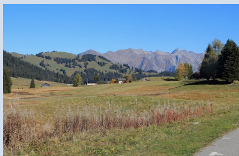
Wikipedia.ch (Passhöhe Col de Mosses)