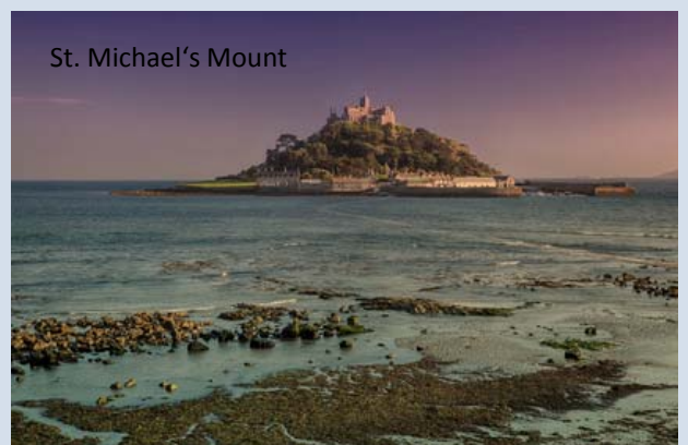
St. Michael's Mount