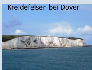
Kreidelfelsen bei Dover